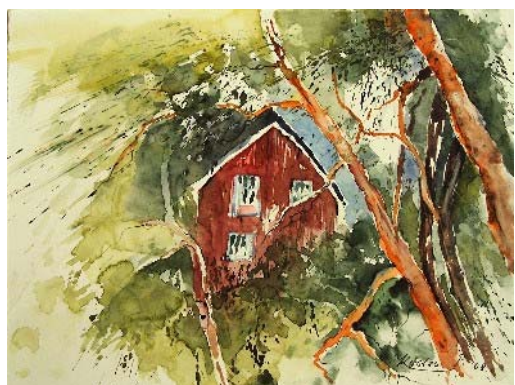
Abb. 7 Ehem. Künstlerhaus in Nidden Aquarell, 2008