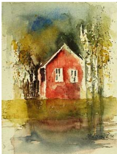
Abb. 24 Rotes Haus mit Birken, Aquarell, 2008 (in Erinnerung an Evi, eine wunderbare Malerin)