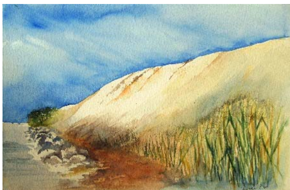
Abb. 10 Hohe Düne von unten, Aquarell 2008

Nun stand also heute die Düne an. Die Malrucksäcke mussten ein Stück geschleppt werden (einige Malerinnen hatten praktischerweise ihre Männer mit, die schnell den Spitznamen der Gepäckträger weg hatten).