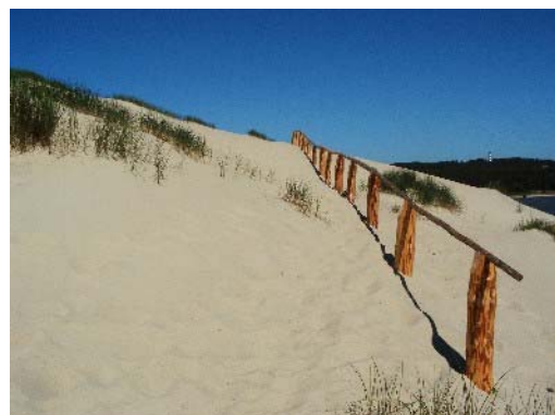
Abb. 11 Aufstieg auf die Hohe Düne