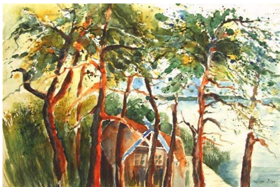
Abb. 22 Blick vom Mann-Haus, Aquarell, 2008

Bernstein und Leinenkleidung einkaufen war auch noch angesagt, nachdem man die Woche über geschaut und den Markt ausgekundschaftet hatte, um dann so richtig zuzuschlagen. So billig gibt es Bernstein wohl nie wieder, da auch in Litauen 2009 der Euro eingeführt wird.