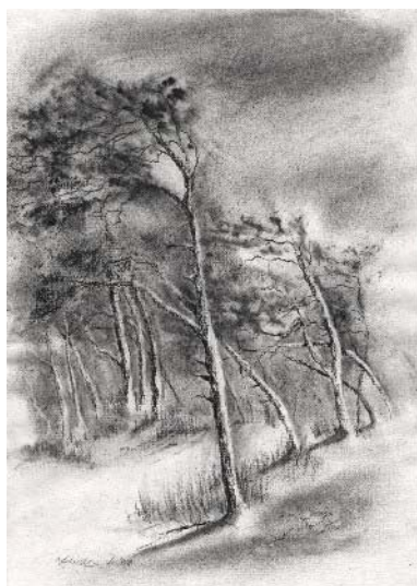
Abb. 2 Dünenwald auf der Kurischen Nehrung, Kohle, 2008

Die Besatzer des Deutschen Ordens, die Franzosen Napoleons, vor allem aber die Russen holzten die über Jahrhunderte gewachsenen Wälder auf der Nehrung rücksichtslos fast vollständig ab. Die hochwertigen, festen Kiefern mit ihren schmalen Jahresringen waren begehrtes Bauholz für Schiffe und flach im Wasser liegende Galeeren. Herden frei laufender Kühe und Pferde der Besatzer zertrampelten die natürliche Dünenbefestigung, der Rest der nun lichten Wälder bot eine ideale Angriffsfläche für Sandstürme. Die ca. 2 qkm Sand, die die Nehrung bedeckten, setzten sich als wogende Sanddünen in Bewegung und begruben seit dem 16. Jahrhundert insgesamt ca. 14 Dörfer und Siedlungen unter sich. Ganz genau weiß man nicht, wie viele kleine Siedlungen unter den Wanderdünen ruhen. Nida/Nidden musste dreimal seinen Standort verlegen.