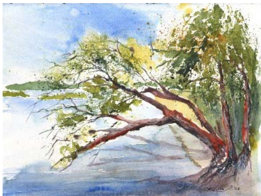
Abb. 16 Im Memeldelta, Aquarell 2008

Es passierte etwas, das wohl in keinem profitorientierten Touristenzentrum á la „Playa XYZ“ möglich wäre: Das Schiff machte kurzerhand kehrt, fuhr zurück ins Delta bis zu einer Stelle, wo die malerischsten Bäume fast die Wasseroberfläche berührten und die Wurzeln frei gespült waren, fuhr ans Ufer und setzte das Schiff mal eben einfach auf Grund: „So – nun könnt´ Ihr malen..“ Und wir haben gemalt!