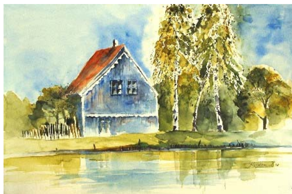
Abb. 15 Haus mit Birken an der Minge, Aquarell, 2008

Dann ging es auf Motivsuche entlang des Flusses.