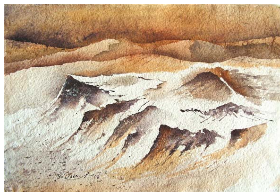
Abb. 14 Hohe Düne II, Aquarell, 2008