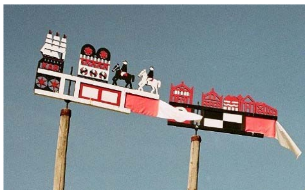
Abb. 6 Kurenkahnwimpel

Bei unserem Rundgang durch den Ort fielen uns immer wieder die liebevoll geschnitzten Giebel und Giebelkreuze auf, häufig mit Tier- und Schifffahrtsymbolen.