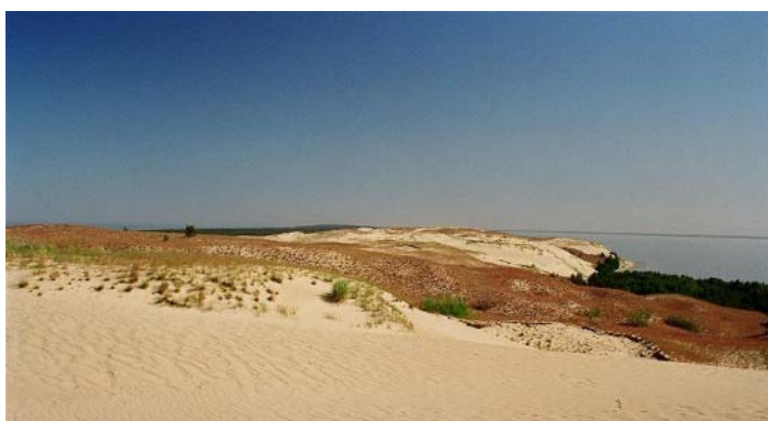
Abb. 17 Tote Düne bei Juodkranté

Kurz vor Juodkranté machten wir zunächst Halt an der sog. „Toten Düne“, einer der großen Dünengebiete, die es auf der Kurischen Nehrung noch gibt. Der Name ist darauf zurückzuführen, dass diese Düne durch die dichte Bewaldung der Meeresseite keinen Sandnachschub mehr bekommt, an der Haffseite aber immerwährend Sand ins