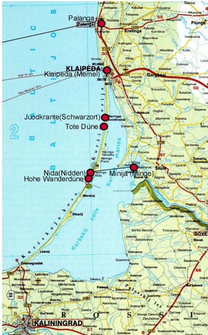
Abb. 1 Die Reiseroute