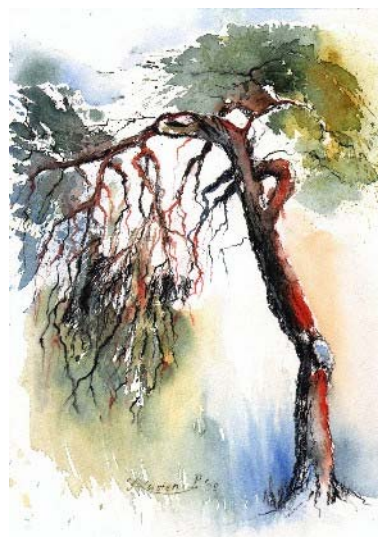
Abb. 3 Krüppelkiefer am Thomas-Mann-Haus, Kohle und Aquarell, 2008

Von den Schrecken der Pest und den Ängsten vor den wandernden Dünen zeugt sehr eindrucksvoll das Gedicht der „ Frauen von Nidden “, das die ostpreußische Dichterin Agnes Miegel (1879 bis 1964) geschrieben hat. Dieses Gedicht (folgende Seite) beschreibt den Untergang des alten Nidden.