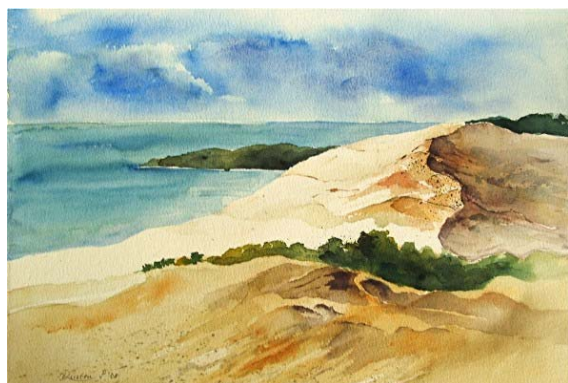
Abb. 13 Hohe Düne I, Aquarell, 2008

So spannend und vielseitig kann Aquarellmalerei sein!