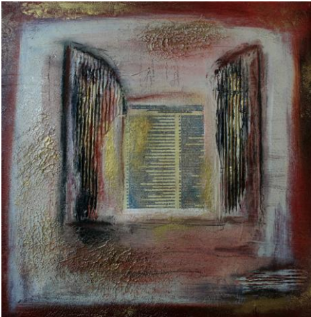
„Aufbruch“ – Teil des Zyklus „Reformation“ (2011)

Erneut greifen wir ein Thema auf, das uns bereits beschäftigt hat: die Einbeziehung verschiedenster Papiere und Materialien in Bilder. Als Collage bezeichnet man ein Bild, bei denen die Ursprünglichkeit der eingearbeiteten Materialien erhalten bleibt, bei einem Materialbild hingegen dient das Material nur als zugrundeliegende Struktur und wird farblich überarbeitet, mit Rost überzogen, vergoldet etc.